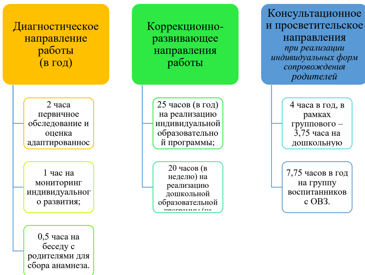
График организации образовательного процесса